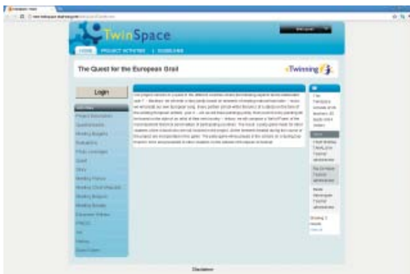
Сайтът на проекта, направен в платформата eTwinning.

За единия от проектите „Коменски“, по които работихме през изминалите две години, използвахме платформата eTwinning за сайт на проекта. Темата на проекта е „В търсене на европейските ценности/европейския граал“ (“The Quest for the European Grail”, http://new-TwinSpace.etwinning.net/web/p18453/welcome ). Началото на проекта съвпадна с обновяването на сайта eTwinning. Осъществихме качването на всякакъв вид документи, снимки, видео файлове, подкаст и много удачно я използвахме за проекта „Коменски“. Имаме форум и блог, където публикувахме текущите задачи и някои от крайните продукти. Проектът завърши с игра, която се състоеше от въпроси, върху чието съдържание сме работили през двегодишния период на проекта.