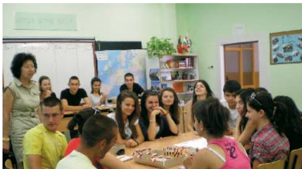
Ученици играят играта „Граал или затвор“ през юни 2011 г.